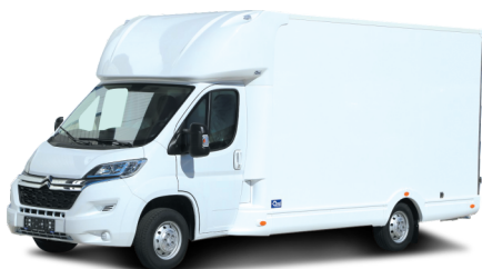
Optional Seitenverkleidungen in Wunschfarbe lackiert