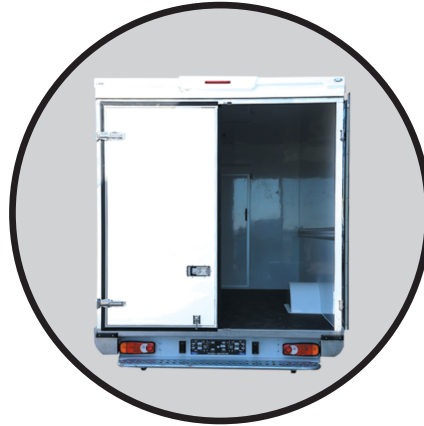
1 x Zurrleiste pro Seite