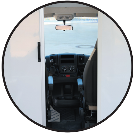
Durchgang Fahrerkabine zum Aufbau, ergonomisch in Stehhöhe